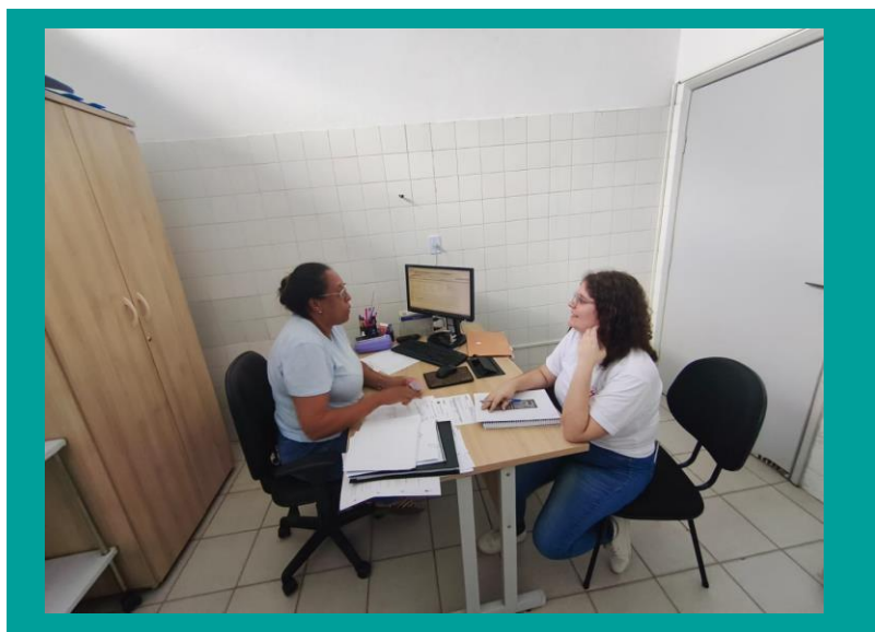
Articulação saúde posto COHAB bandeirantes