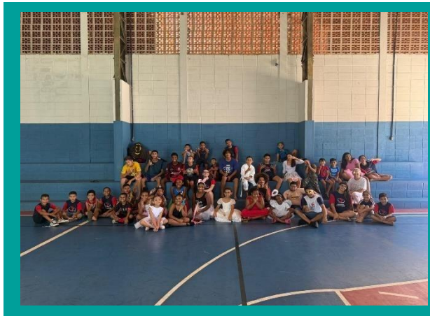
Reunião de Pais